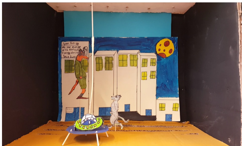
Rotkäppchen in der Stadt: Screenshot aus einem Video, das von Schülern produziert wurde.

Die Disneyverfilmung „Neu Verfohnt“ von 2012 des klassischen Märchens „Rapunzel“ der Gebrüder Grimm ist nur ein Beispiel dafür, dass Märchen auch im Zeitalter von Whatsapp und Facebook immer noch sehr beliebt sind. Dieses Phänomen wollen wir in diesem Projekt aufgreifen und uns anhand mehrerer klassischer Märchen anschauen.